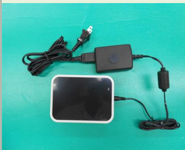
携帯型量子発生器 THP-24D 型

何千年の間、人類の健康を苦しめてきた 目に見えない4次元の有害エネルギーから、 人類を遂に開放