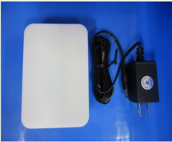
携帯型量子発生器 THP-05 型